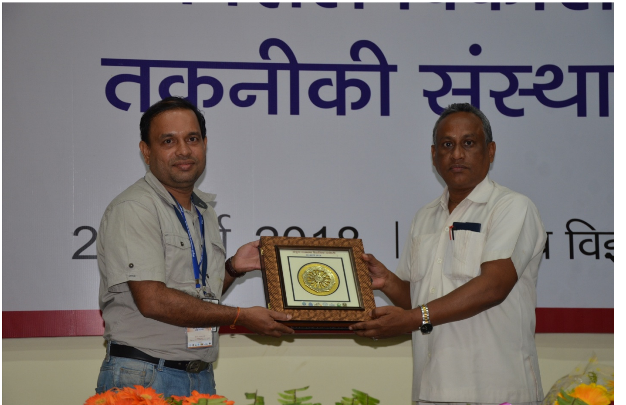
(जीव विज्ञान संस्थान के प्रतिनिधि को स्मृतिचिह्न प्रदान किया जा रहा है)