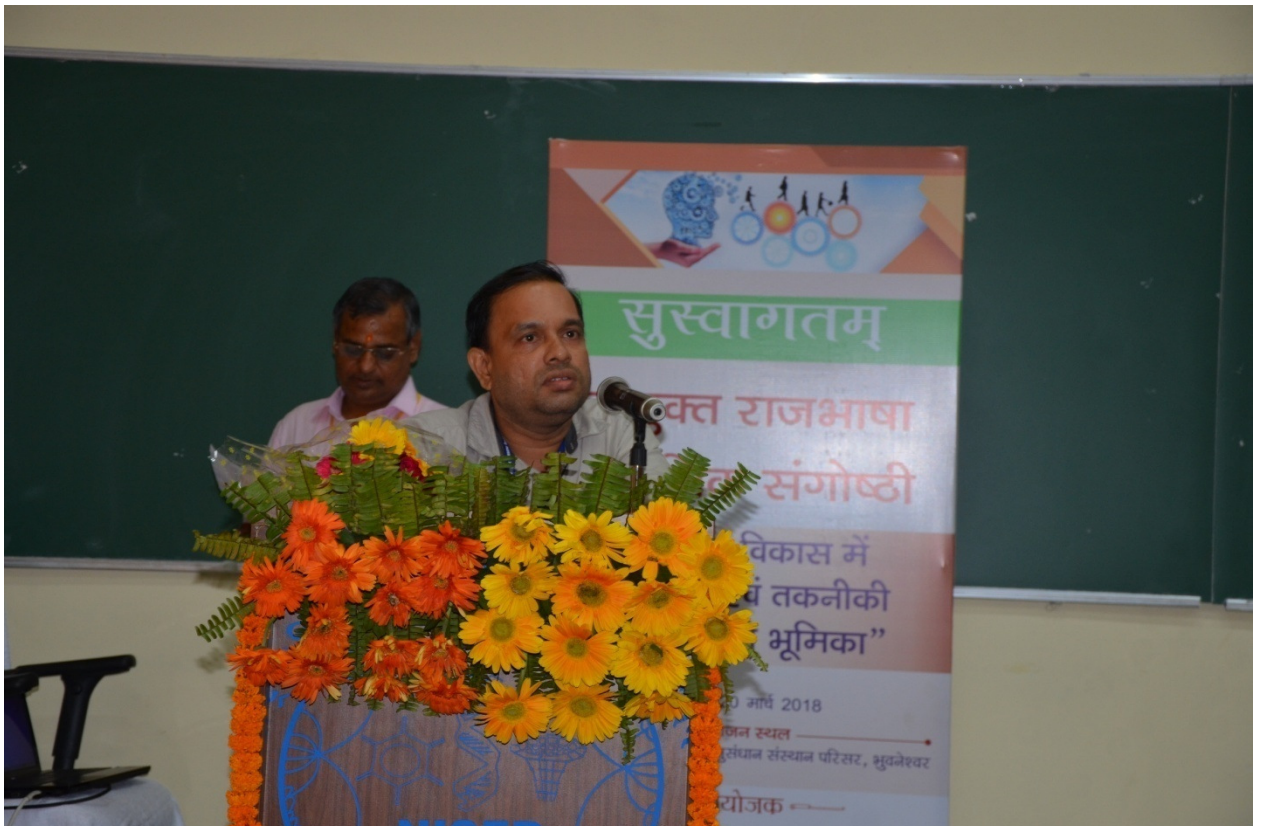
(जीव विज्ञान के प्रतिनिधि अपनी प्रतिक्रिया व्यक्त करते हुए)