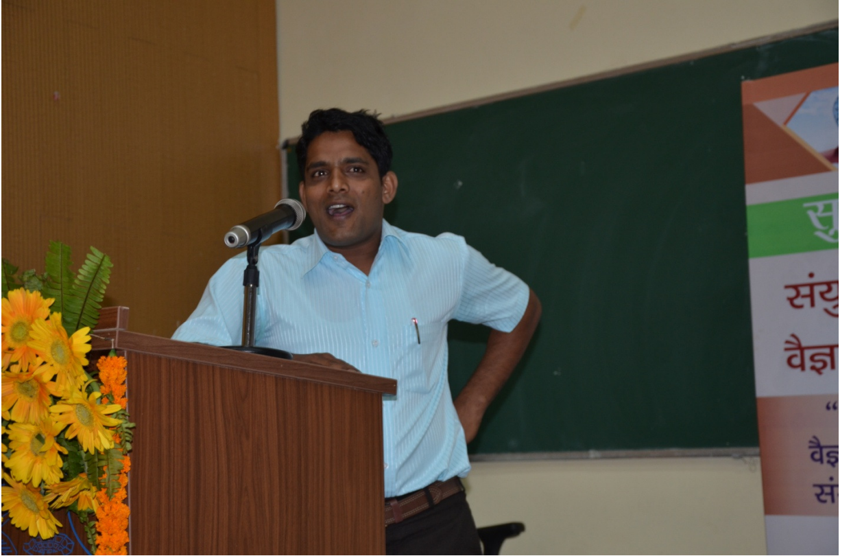
(नाइसर के प्रतिनिधि अपनी प्रतिक्रिया बताते हुए )