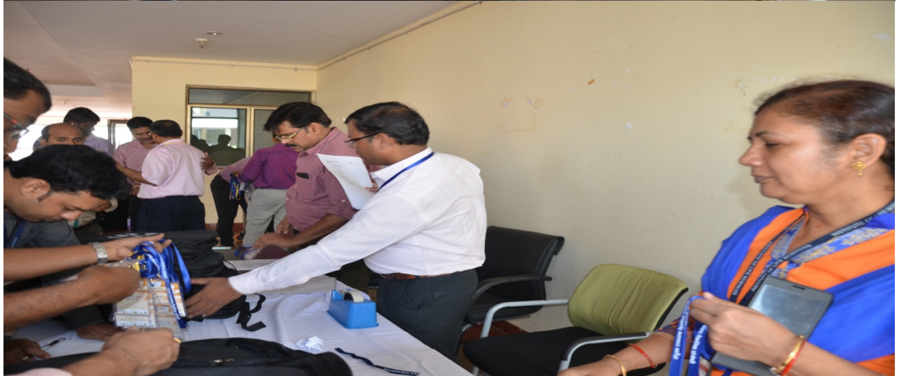
पंजीकरण करते हुए प्रतिभागियों का एक दृश्यचित्र