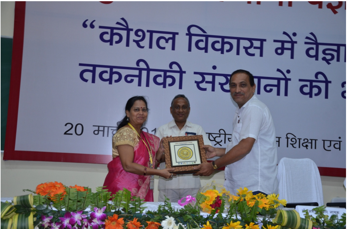
(सीवा के प्रतिनिधि को स्मृतिचिह्न प्रदान किया जा रहा है)