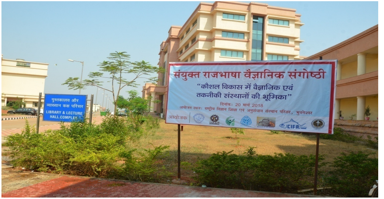
आयोजन स्थल : राष्ट्रीय विज्ञान शिक्षा एवं अनुसंधान संस्थान, जटनी परिसर स्थित व्याख्यान कक्ष परिसर का एक दृश्य