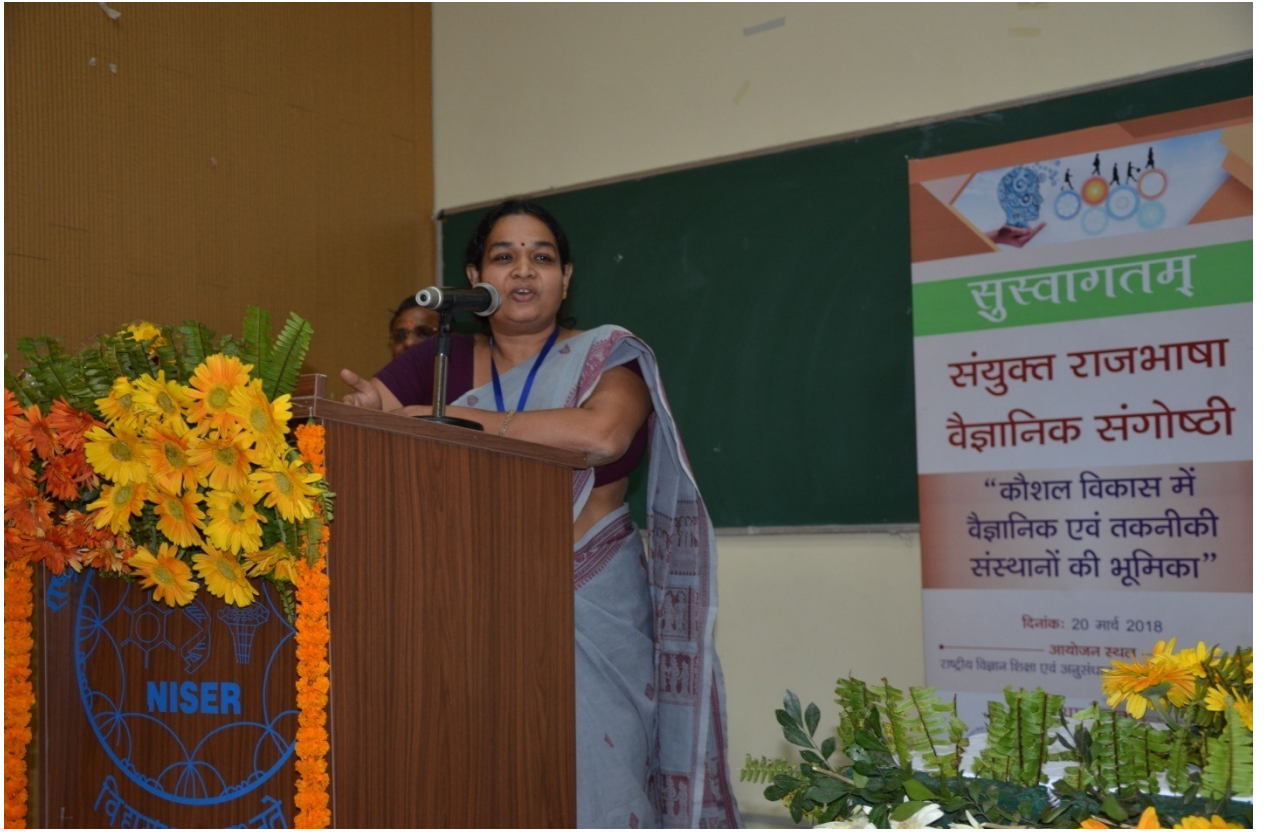
(सीवा की महिला वैज्ञानिक अपनी प्रतिक्रिया बताती हुई)