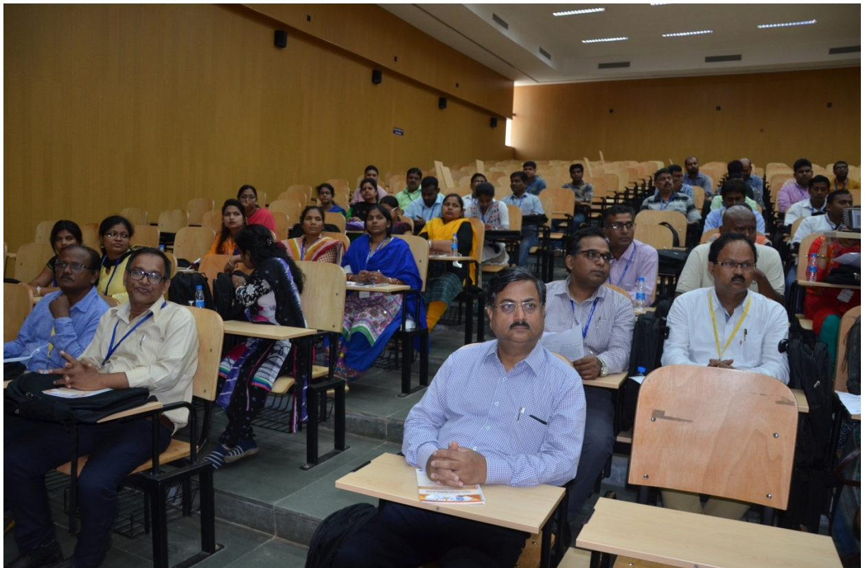
सभागार में उपस्थित प्रतिभागियों का एक दृश्य