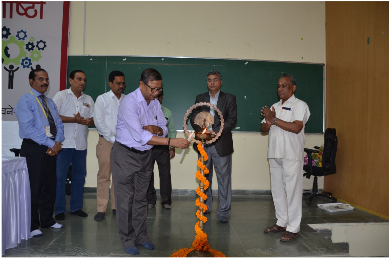
उद्घाटन सत्र के दौरान द्वीप प्रज्वलन करते हुए अतिथिगण