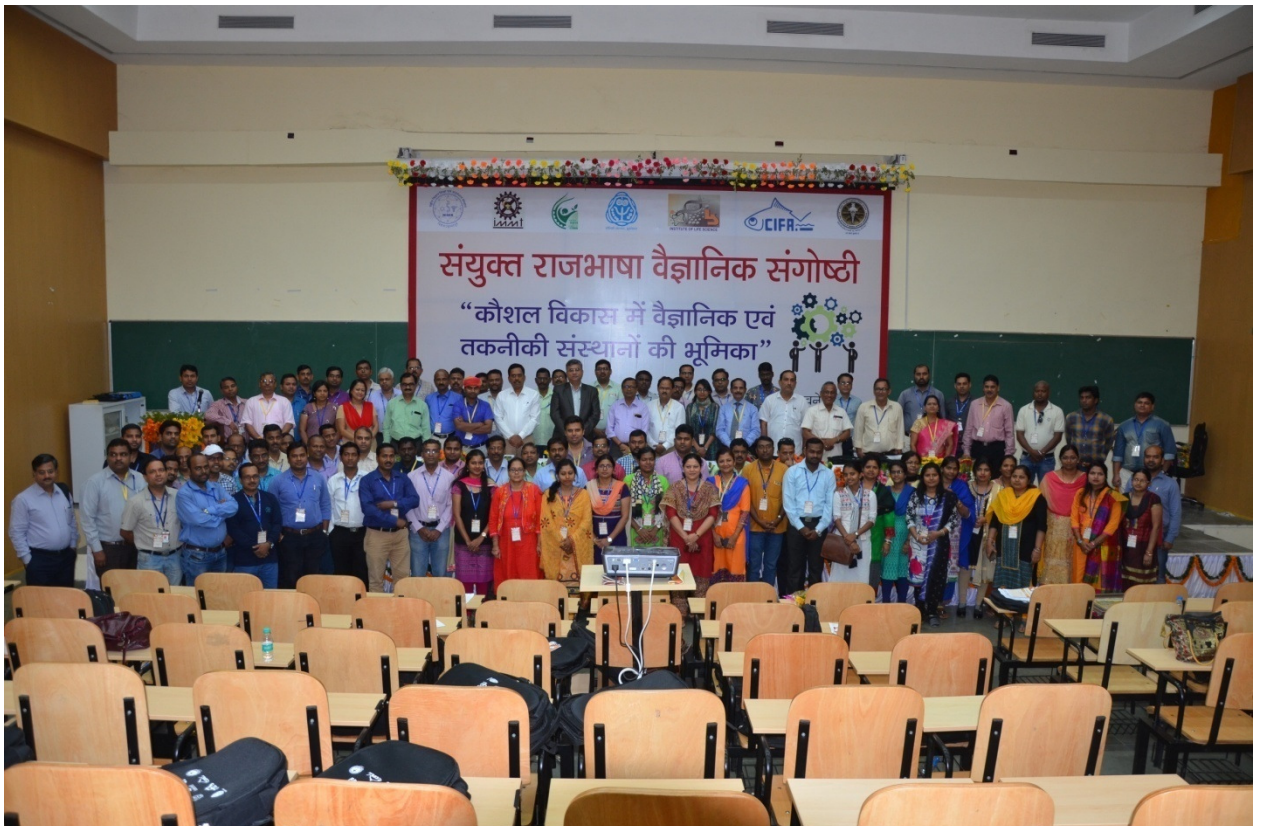
(संगोष्ठी के प्रतिभागियों का एक फटोचित्र)